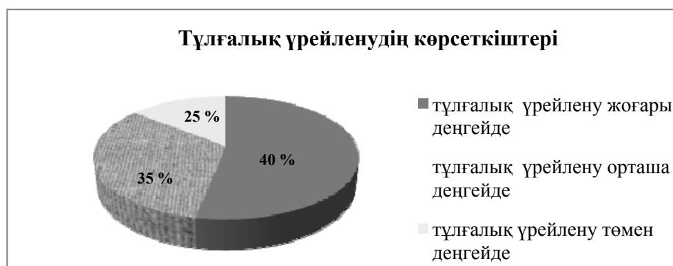
1-сурет. Ч.Д.Спилбергер мен Ю.Л.Ханиннің үрейленуді анықтауға арналған сұрақнамасы бойынша тұлғалық үрейленудің көрсеткіштері

Әдістеменің негізінде алынған нәтижелерді тұлғалық және жағдайлық үрейлену бойынша жеке-жеке есептедік. Әдістемеге сәйкес, жағдайлық үрейлену ретінде студенттердің жоғарғы оқу орнындағы жаңа оқу жағдайына бейімделу жағдайын алдық. Алынған сандық көрсеткіштердің сапалық талдауына келетін болсақ, тұлғалық үрейлену шкаласына байланысты үш деңгей анықталды: 25 % сыналұшылардың бойында бұл жоғары деңгейде, 35 % сыналұшыларда орташа деңгейде, 40 % сыналұшыларда төмен деңгейде екендігі анықталды. Тұлғалық үрейлену шкаласы, адамның тұрақты жеке сипаттамасын білдіреді. Көрсеткіштерді 1-суреттен көруге болады.