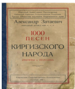
Фото 7. КП 2732(Д). Книга песен. 1925 г. Оренбург. Картон, бумага, типографская многоцветная печать. Разм. 17,5x26 см. Книга А. Затаевича «1000 песен киргизского народа. Напевы и мелодии». Киргизское государственное издательство. Из фондов ЦГМ РК