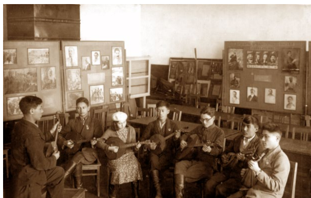
Фото 3. Петропавловское казахское педагогическое училище. Участники художественной самодеятельности.