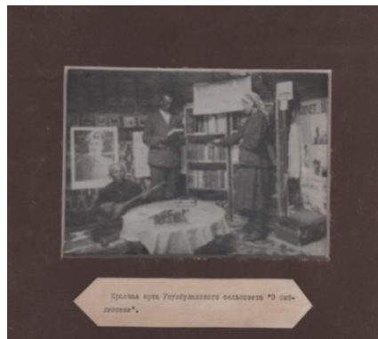
Фото 2. КППМ 3231/3. «Красная юрта» Узун-Булакского сельсовета

Самодельные кружки, ансамбли создавались как при «красных уголках» и «красных юртах», так и в школах и других образовательных заведениях (фото 3), где хоровое пение вводилось в учебный процесс. Так, одним из первых коллективов художественной самодеятельности стал казахский хор под управлением дирижера И.В. Коцька (фото 4), созданный им в 1924 г. при Педагогическом училище г. Петропавловска. В 1925 г. хор уже выступил на концертах казахской народной музыки в г. Москве.