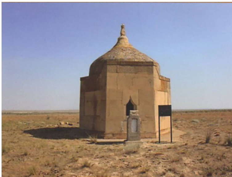
Сурет 5. Сүндет кесенесі [14; 115]

Т.Қ. Бәсенов осы аумақтағы кесенелерді зерттей келе, оның шығу тарихын және таралау аймағын қарастырады. Кесенелерді феодалдар, жартылай феодалдар салғандығын, ал ортаңғы таптың адамдары өздерінің туыстарының қабірінің үстіне құлпытастар қойғаны туралы дерек келтіреді. Құлпытастың кесенелерде қойылуы да кездесетіндігі айтылады. Мұндай ескерткіш-тастарды орнату салыстырмалы түрде арзан және қарапайым халыққа қолжетімді болғандықтан кеңінен таралған деген болжам айтылады. Қазақстанда мұндай ескерткіштер бүкіл аумаққа шашыраңқы болып келеді және тұтас архитектуралық топты құраған.