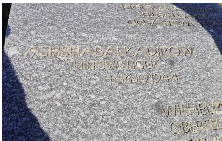
12-сурет. Футапасс неміс әскери зиратындағы Ақшай Қадыров бейітіне қойылған тастақта. Тоскана, Италия.