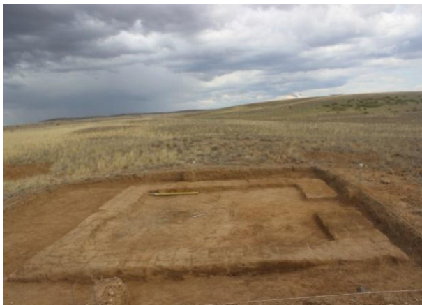
2-сурет. Қазба барысында ашылған құрылыс

Құрылыстың ішін тереңдетіп тазарту барысында, солтүстік бұрышқа жақын жерден ұзындығы 2,4 м, ені 1,2 м қабір шұңқырының ізі байқала бастады. Осы шұңқырды аршу барысында 0,46 м тереңдікте орташа көлемдері 25×25×5 см келетін күйдірілген кірпіш үйіндісі кездесті. Қабірдің үстін жабу үшін арнайы қойылған кірпіштердің ретсіз шашылып жатқанына қарағанда шұңқырдың бұрын ашылғандығын немесе тоналғандығын аңғаруға болады. Одан әрі тазарту барысында 0,8 см тереңдікте қабір шұңқырының ішкі жағын сылаған қалыңдығы 10 см болатын сазды сылақтары мен оның астынан ағаш табыттың қалдықтары ашылды. Ағаш табыт қатты бұзылған, жоғарғы бөліктері әбден шіріген тек астыңғы аз ғана бөліктері сақталған. Шұңқырдан 0,9 м тереңдікте басы солтүстік-батысқа бағытталған жерленген адамның сүйектері аршылды (3-сурет). Адам аяқ-қолдары созылып, қос білегі жамбасының үстіне қойылып, шалқасынан жатқызылған. Адамның оң аяғының тізесінен төмен сүйекке жабысқан былғарының қалдықтары байқалды. Органикалық қалдық қатты шіріп, күлге айналып кеткендіктен сақтап қалу немесе қандайда бір зертханалық талдау жасау мүмкін болмады.