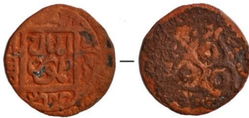
4-сурет. Қазба барысында табылған мыс монета

сақталуына қарағанда қолданыста ұзақ болмаған. Сондықтан монета соғылған уақытынан бастап 10–15 жыл шамасында ғана пайдаланылған деп қорытынды жасауға болады. Олай болса тиынның қолданыс аясынан шығуы немесе археологиялық жәдігер ретіндегі тарихы XIV ғ. соңғы жылдарына сәйкес келеді.