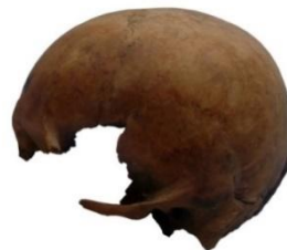
5-сурет. Қалпына келтірілген бас сүйек: алдынан және сол жақ қырынан қарағанда.