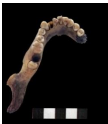
6-сурет. Астыңғы жақ сүйек.

Қалпына келтіруден кейін бас сүйек өлшенбеді. Тістердің тозуы / сырылуы және эктокран жіктеріне қарай (Lovejoy, 1985 бойынша) бас сүйек шамамен 20–25 жас аралығындағы жас әйел адамға тиесілі. Мұндағы 22 жас төменгі 3-азу тістің шығуына байланысты шамалап беріліп отырған уақыт.