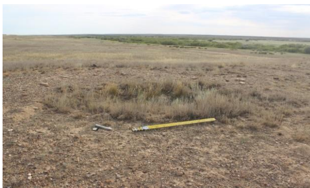
1-сурет. Зерттелген нысанның қазбаға дейінгі көрінісі

2020 жылғы археологиялық қазба жұмыстары Жошы хан кесенесінен солтүстік-шығысқа қарай 900 метр жерде орналасқан (географиялық координаттары 48°09'49.0" ШБ 67°49'19.1" СЕ) аласа төбенің үстіндегі жерлеу орнында жүргізілді. Төбенің үстінде солтүстік-батыстан оңтүстік-шығысқа қарай тізбектеле орналасқан бірнеше жерлеу орнының белгілері байқалады. Жерлеу орындары шағын топырақ үйіндісе ретінде ғана сақталған (1-сурет). Диаметрі 6 м., биіктігі 30–35 см болатын дөңгелек пішінді шағын үйінділердің біріне көлемі 7×7 м қазба салынды.