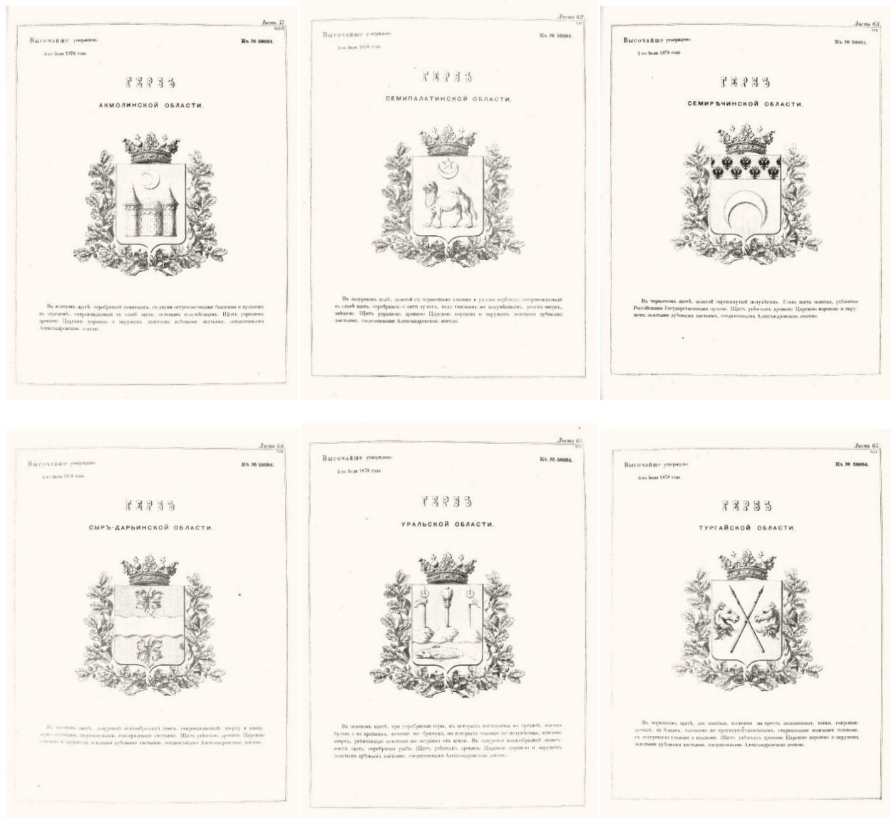
Сурет 1. Ақмола, Семей, Жетісу, Сырдария, Торғай және Орал облыстарының елтаңбалары

Қала тұрғындардың жаңа қызмет түрлерін ғана қалыптастырып қоймайды, сонымен қатар жаңа типтегі адам — қала тұрғынын жасап шығарады. Қала өз тұрғынына өндірістік қызметтің бұрын таныс емес түрлерін игеру — еңбек операцияларын бөлу, мамандану талаптарын қояды. Олардың арасындағы байланыс тауар-ақша қатынастары негізінде жүзеге асады. Адам қалалық ортада әрі өндіруші, әрі тұтынушы ретінде көптеген рольдерге түседі.