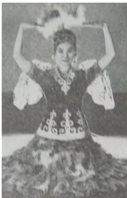
2-сурет. «Қошқар мүйіз» қол қалпы