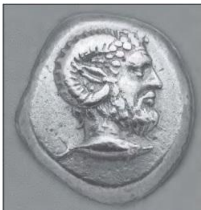
7-сурет. Қошқар мүйізді Зевс-Амонның басы. Мирмекиядан (Қырым) табылған Қызыкин статері (антикалық тиын ақша), б.з.д. 5 ғ-ң 2-жартысы [28: 144].

Қазақ халық биіндегі әйелдердің негізгі айналмалы қол қимылы — қол саусақтарын өзіне қарай және өзінен сыртқа айналдыру «Айналма» [18: 35-36] қимылы да қошқардың бұралған мүйізіне ұқсайды. Бұл қозғалыстың атауы қазақ тіліндегі қазақ аналары әдетте балаларына арнап айтатын «Айналайын» деген қасиетті сөзбен бір түбірден тұрады. Бұл сөздің мағынасы: «Сені айналып, сенің бар ауруыңды, қазаларыңды өзіме аламын», – дегенді білдіреді.