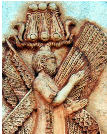
5-сурет. Пасаргадтағы Мысыр құдайларының бас киімін киінген қос мүйізді Кир II (Куруштың) бедерлі мүсіні [27].

Көптеген халықтарда: мысырлықтар, немістер, шумерлер және басқа да көптеген халықтарда мүйіз құдірет белгісі боп саналды. Грек пантеонының басты құдайы Зевс қошқар мүйізімен бейнеленді. Мүйізі бар дулығаларды патшалар киген. Мұсылман халықтарының фольклорында екі мүйізді Ескендір (Құрандағы Зу-ль-қарнайын, القرن ین ذو , араб тіл. ауд. – қос мүйіз иесі) Алла құдірет беріп, жердің екі шетіне, Шығысы мен Батысына, «күн шығатын» және «күн бататын» жерге [24] дейін жетуге мүмкіндік берген ислам дінінің жақтаушысы, Мұхаммедке дейін өмір сүрген Жаратушы елшісі және пайғамбары болып саналды. Е.А. Костюхин [25: 125-126] «Александр Македонский әдеби және фольклорлық дәстүрде» деген кітабында этнограф Д.И. Эварницкий (1893) және Г.Н. Потаниннің (1916) халық аузынан жазып алған қос мүйізді Ескендір туралы қазақтың екі халық аңызын мысал ретінде келтіреді. Алайда Зу-ль-қарнайынның түп тұлғасы Ескендір (Александр Македонский) емес, Кир II болған деген пікір де бар [26], (5-сурет).