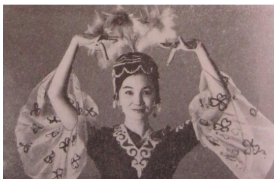
4-сурет. «Киік мүйіз» қол қалпы

Түркі халықтарының наным-сенімдері бойынша көшпелі халықтың негізгі тағамы болып, мүйізі май болған жануар қошқардың мүйізі «құт» — күш, сәттілік, бақытпен барабар саналды. «...Қазақтар арасында кеңінен танымал бұл түсінік Орта Азия, Оңтүстік Сібір, Моңғолия, Солтүстік Кавказ, Үндіқытай, Африка халықтарының ұқсас ұғымдарымен сәйкес келеді. Көне дәуірде «От-Аспанмен» байланысты сәттілік, ұрпақ сыйлайтын «ғарыштық қошқарға» табынудың кең тарағанын көне мысырлықтарда қошқар басы бар сфинкстер түріндегі күн құдайы Амонның бейнелері; Кушан мен Хорасан, Ферғана патшаларының алтын қошқар түріндегі тақтары; аргонавтардың алтын жүнді қошқар терісі үшін жорығы және т.б. дәлелдейді. Осы нанымдарға ежелгі ирандық Фарнның бір