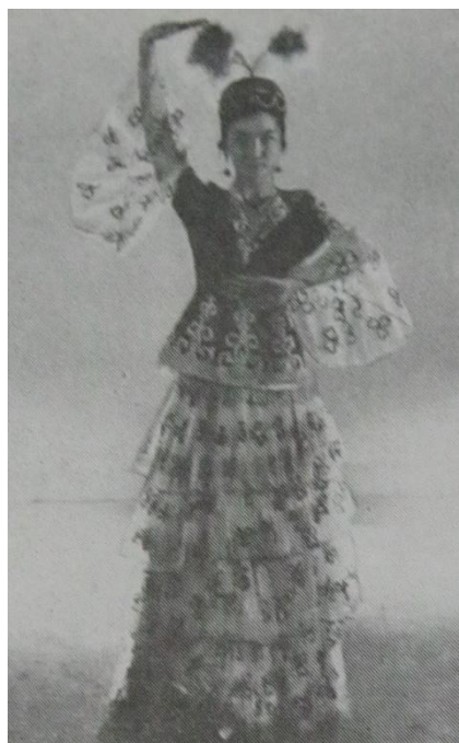
3-сурет. «Сыңар мүйіз» қол қалпы