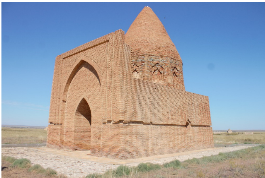
Сурет 6. Абат-Байтақ кесенесі

Шақпақ ата, Қараман ата, Балғасын); 2) кейінгі ортағасырлық XIV ғ. (Кенді баба, Үштам, Масат ата, маңғыстаулық Қошқарата, үстірттік Қошқар ата, Сисем ата, Абат-Байтақ, Қарасақал, т.б.); 3) жаңа уақытта қалыптасқан кешендер — XVIII-XIX ғғ. (Қарашық, Қызылсу, Сағындық, Бейсембай, Алып ана, Дәуімшар, Нұрманбет, Дәуіт ата, Қарабас әулие, Хан моласы және т.б.) [3; 34].