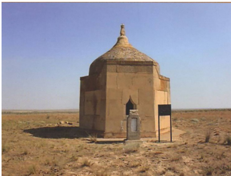
Сурет 5. Сүндет кесенесі [14; 115]