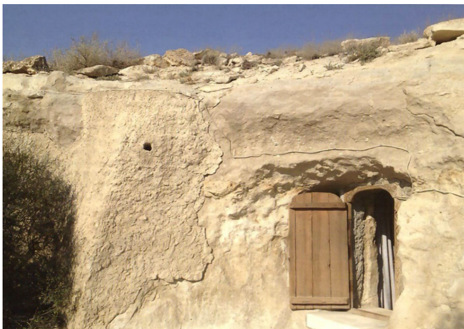
Сурет 1. Шопан ата жерасты мешіті [8; 228]

Ғалымның еңбегінде Шопан ата мешіт-мазары аймақтың діни орталығына айналу мақсатында салынғандығы айтылады. Оған дәлел ретінде бөлменің үш негізгі топқа бөлінген құрамын атап өтеді. Бөлменің орталық бөлігінде қонақ бөлмесі іспетті жасақталған төртбұрышты зал орналасқан. Орталық залдың оңтүстік-батысында көлбеу орналасқан баспалдақ жоғарғы қабаттағы құлшылық бөлмесі мен екі жерлеу орнынан тұратын қабірлер бөлмесіне апарады. Орталық залдың оңтүстік және батыс қабырғаларының бүкіл ені зиярат етушілерге арналған екі кең бөлмеге бөлінген. Ыдыс-аяқтар: самаурындар, шәйнектер, құмған және басқа да тұрмыстық ыдыстар солтүстік қабырға бойына орналастырылған. Ауа райының әсерінен мешіттің солтүстік қабырғасы қатты зақымданған. Бұл мешіт-мазардың нақты мерзімі туралы дәйекті ақпараттар жоқ, себебі белгілі жазба деректерде Шопан ата атауы кездеспейді [1; 8, 9].