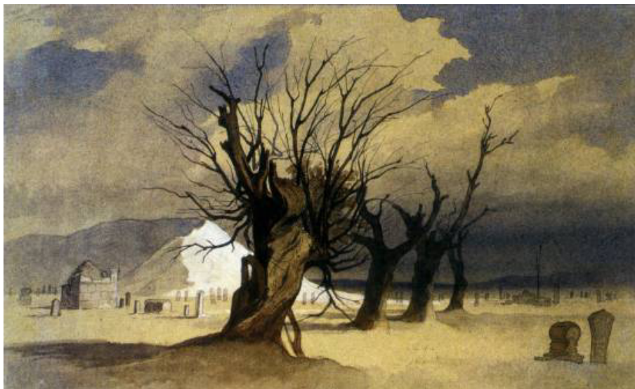
Сурет 2. Ханга-баба [10, с. 25]

Халық аңызы мен жазбаша деректерге қарағанда орта ғасырлар бойы мұнда оғыздар, қыпшақтар, ноғайлар, башқұрттар, түркімендер және қазақтардың тайпалық топтары және XVIII ғасырдың үшінші жартысында қалмақтар кезекпен көшіп-қонып жүрген (Мендикулов, 1956). Осы мәліметке сүйене отырып ғалым Бейнеу қорымының ең ежелгі құлпытастарын оғыз-қыпшақ және қыпшақ-ноғай тайпалары салуы мүмкін деген қорытындыға келеді. Қорымдардың кирап кетуіне байланысты олардың салыну уақыты мен этникасын анықтау мүмкін болмаған.