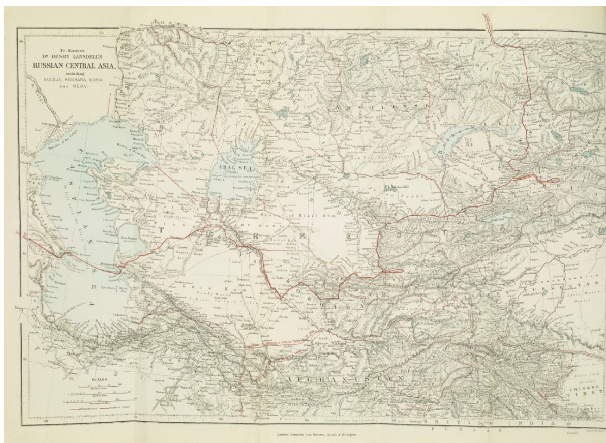
Figure 1. Henry Lansdell's map of Russian Central Asia, including Kuldja, Bokhara, Khiva and Merv

The map by Lansdell was presented to King Edward VII in 1885, but he was still to the then Prince of Wales [13].