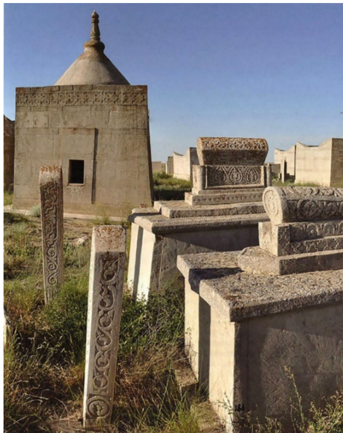
Сурет 7. Сисем ата [8; 236]

«Маңғыстау мен Үстірт ескерткіштері» кітап-альбомының жарық көруі С.Е. Әжіғалидың осы аймақты зерттеу бойынша ең үлкен жетістігі болды [20; 504]. Ол өзінің көп жылдық жұмысы барысында теориялық және практикалық зерттеулердің негізгі нәтижелерін ұсынды. Ғалым көптеген жылдар бойы мемориалдық және діни ескерткіштердің типологиясын зерттеумен айналысты. Оны көшпенділердің мемориалдық және діни ескерткіштерін зерттеудің негізі деп санауға болады. Зерттеуші олардың барлығын екі үлкен бөлікке: ғұрыптық және мемориалдық ескерткіштер деп бөлуді ұсынды. Ол алғашқы топқа мешіттер мен әр түрлі ғибадат орындарын жатқыза, екіншісіне (ең кең таралған) — мемориалдық ескерткіштерді (жерлеу орындары, қабірлер) жатқызды [20; 142, 148].