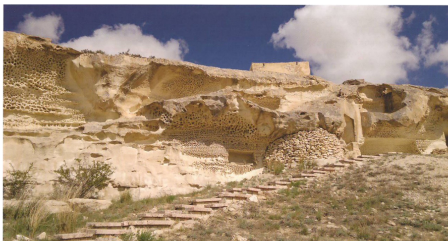
Сурет 3. Шақпақ ата жерасты мешіті [8; 233]

Батыс Үстірт аумағында Шақпақ ата жерасты мешіті сияқты халық аңыздарында қыпшақ-ноғайлы кезеңімен байланыстырылатын ежелгі ескерткіштер бар (сурет 3). Қорымның оңтүстік-батыс бөлігінде жерасты мешіті және Шақпақ ата мен оның қызының қабірі орналасқан. Олар тау массивіне ойылып, саңылаулармен байланысқан шағын камера болды [6; 11].