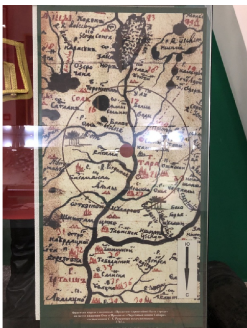
Figure 1. Omsk State Museum of Local Lore — A fragment of a map with the inscription «It is necessary (proper) for the city to be» at the place of Om's possession in the Irtysh from the «Drawing book of Siberia» compiled by S.U. Remezov and his sons 1701

Russian negotiations with the Kazakh nomadic elite were extremely important, it was during these negotiations that the idea of building a fort on the Or River first arose, where Kazakhs could trade with Russian merchants who did not have direct access to the Central Asian caravan trade. Kazakhs were also interested in barter trade at the borders. Becoming Russian subjects promised them temporary permits for winter crossings to the inner parts of the empire's border. In the first decades of the 18th century, the Russian Empire did not interfere in the internal or external affairs of the new and, to a greater extent, formal subjects. There were no attempts to penetrate the empire deep into the territories of the Kazakh Khanates. The steppe was a kind of buffer zone between the Russian empire and Qing Dynasty [2, p. 16] (Fig. 1).