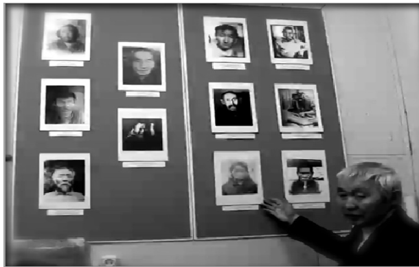
Figure 2. Archived photographs of dead ojun (shamans)

When I sat down in the office of the algus , he began taking out eleven archived photos that were photographed before 1930s preserved by the algus himself. Although the algus is an elder who attends to affairs of the Sakha community, the algus also preserves Sakha tradition by safekeeping drums, costumes and photographs of 'shamans' or ojun . On the wall hung photographs of deceased ojun . As the photo below shows, the algus is an older man who has lived through Soviet rule. With not so many words, the algus alluded to a poignant remark that 'shamanism' exists in obscurity in the minds of people; most people would say that no ojun are alive, that ojun have died out, they have never seen ojun , and that they are afraid to talk about ojun . From the remnants of Soviet rule, belief in shamanism is not easily expressed, uncertain, vague, un-discovered and primarily kept from being known. Piers Vitebsky (1992, p. 244)* has noted, with regard to the Even peoples of Siberia that the peoples of Siberia may well be living in a 'post-shamanistic society' [1].