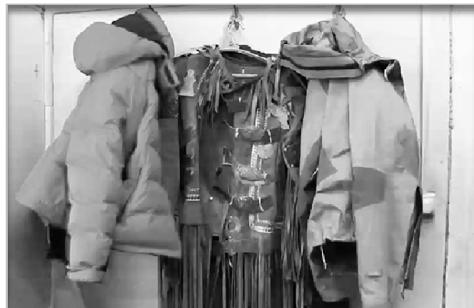
Figure 4. In post-shamanistic society, the ojun costumes hangs between two modern sport jackets.

Vitebsky (1992, p. 244), pointed out that although shamanism died out as an organized public practice, from the 1930s, socialism had confronted 'shamanism' to the point of possible extinction [1]. This is because during 1930s, ojun costume, paraphernalia, ceremony rituals, dance performances, the 'inner' knowledge of ojun , 'shamanic' practices for trance, conjuring up spirit-helpers that ojun used disappeared or ceased to be visible. After the 1990s, (post-Soviet rule) people were also seeking other forms of divination (seeking knowledge of the other worlds). According to Vitebsky, what came after the 'extinction' of ojun were other