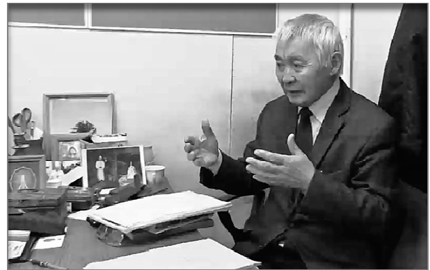
Figure 3. Algus interview April 2013