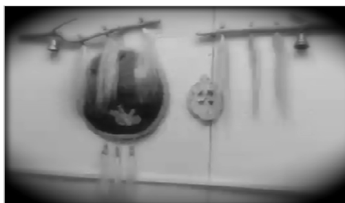
Figure 1. Tree-bark with horsehair used in the aitchelaan blessing.

“It is called ‘ aitchelaan ’, [a Sakha word for blessing of a journey].” A ‘blessing of a journey’ is a way to strengthen the spirit and mind, and physically the body through the vast Siberian land journeyed by foot, horse or reindeer or by car. Before any journey, a person may seek a blessing from an algus , a person who performs blessing rituals. The blessing can take place anywhere and anytime of the season. When an algus performs an aitchelaan , the ritual comprises of ritual song or chant and burning of a tree-bark made special by ‘spirits’. In the high northern latitudes of the Siberian taiga (a dense coniferous forest), particular trees are marked by a distinct physical form, which is taken to be ‘from the spirits’. The tree chosen for rituals have tree-barks that are light in colour, lightweight and uniquely curved in shape. The aitchelaan blessing follows the ‘way of nature’ involving the land, the forest, the spirits.