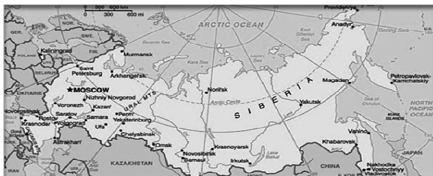
Figure 9. World Fact Book map of Russia

Making any journey through Siberia’s vastness, as the below map shows, requires knowing the ‘ways of nature’ for one to beware of the extreme climate and navigate the immense landscape. Intertwined with the uniqueness of the Siberian landscape is the indigenous quality to live in and from the land. From the land, the peoples of Russia’s Far North continue their survival allowing ideas of ‘personhood’ and revival of ethnic identity to flourish. Similar to other natives and indigenous peoples of the North (Vitebsky, 1992, pp. 243 for ‘Evenhood’ or personhood of the Even reindeer-herders), the Sakha have an intimate connection to the land.