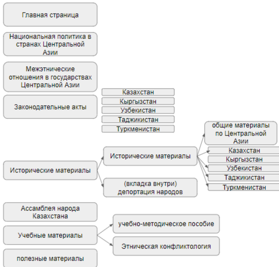
Рисунок. Структура «дерево» Информационной площадки тематического сайта по этнополитике в Центральной Азии

Освещение предварительных результатов по созданию информационной площадки. В процессе работы в библиотечных и архивных фондах библиотек Павлодарского педагогического университета имени А.Х. Маргулана, Областной библиотеке имени С. Торайгырова г. Павлодара, Национальной библиотеке Республики Казахстан и Центральной научной библиотеке РГП «Ғылым ордасы» КН МВОиН РК г. Алматы, в Архиве НАН РК были обнаружены материалы по проблематике проекта в количестве 60 единиц специализированной литературы, а также ряд архивных документов по изучению национального государственного строительства в Институте истории, археологии и этнографии имени Ч.Ч. Валиханова. Полученные материалы монографии, статьи и документы будут размещены на тематическом сайте и будут в общем доступе. Была проведена систематизация материалов согласно принятой структуре Информационной площадки в форме тематического сайта.