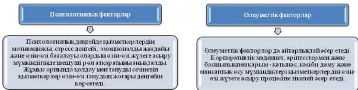
1-сурет. Жеке тұлғаның өзін-өзі жүзеге асыру мүмкіндіктеріне әсер ететін психологиялық және әлеуметтік факторлар

Қызметкерлердің әртүрлі топтары арасында сапалы және сандық сауалнамалар жүргізгеннен кейін жеке тұлғаның өзін-өзі жүзеге асыру мүмкіндіктеріне әсер ететін психологиялық және әлеуметтік факторларды терең талдауға мүмкіндік беретін кең ауқымды деректер жинағын алдық (1-сурет).